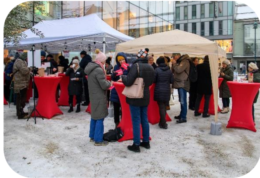
Engagement für ein Fest